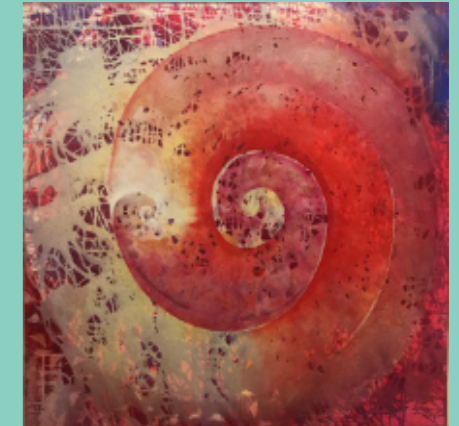
„Spirale im Ohr“

Die „Galerie am Turm“ zeigt an den Wochenenden sowie in den Sommerferien Bilder von Elisabeth Schickling zum Thema „Vom Klang der Farben“. Tel. 08332-470