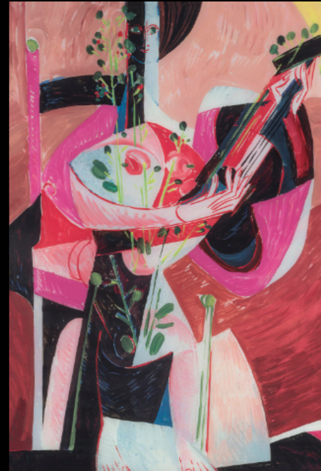
„Dame in rosa mit Gitarre“ Hinterglasbild von Erich Schickling, 1972 Dauerleihgabe der Sparkasse Schwaben-Bodensee

info@schickling-stiftung.de Tel. 08332-936424 oder 0171 9715083 www.schickling-stiftung.de Erich-Schickling-Stiftung Eggisried 29 1/2, 87724 Ottobeuren