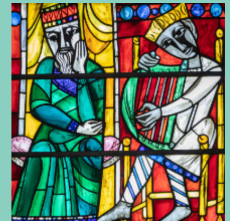
David musiziert für Saul Aus dem Glasfensterzyklus der Neuen Pfarrkirche Altenstadt a.d. Waldnaab