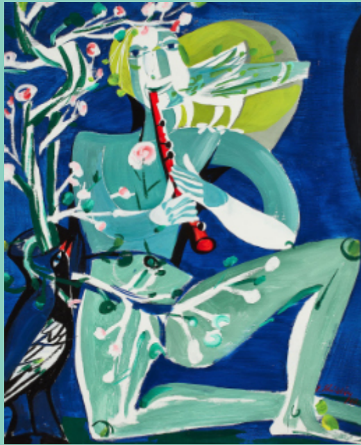
„Papageno“ Tempera-Bild von Erich Schickling, 1968